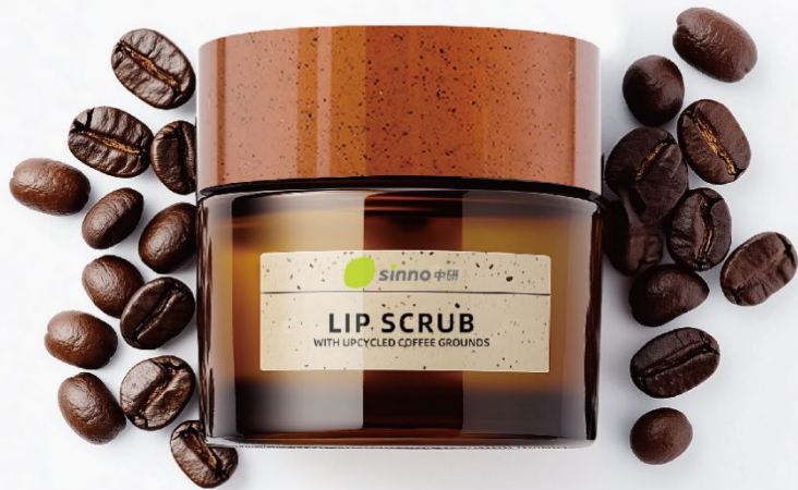
LIP SCRUB With upcycled coffee grounds